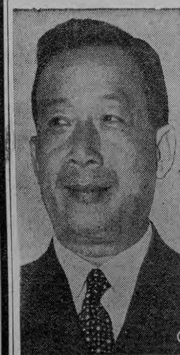
LA ESPERANZA DE LAOS. — El Príncipe Savang Vatthana, de Laos, quizás sea la esperanza de su nación, que encara la amenaza de los rebeldes comunistas contra el pequeño reino budista. Su padre, el Rey Sisavang, de 74 años, según se ha informado, confía grandemente en el Príncipe, de 52 años de edad. De acuerdo con las fuentes militares, los rebeldes se han infiltrado en partes de la provincia de Vientiane, cerca de la capital.

El Senado y la Cámara de Diputados han autorizado 3.556 millones de dólares para el programa, pero la Cámara aprobó únicamente 3.100 millones de estos fondos. El Senado en pleno decidirá sobre el proyecto en que se asignan estos fondos una vez que haya recibido la recomendación de la comisión de asignaciones.