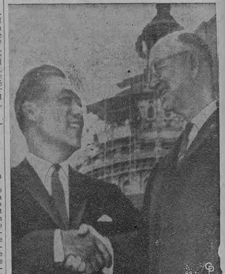
LISTOS PARA PRESTAR JURAMENTO. — Los recién electos Senadores por Hawaii, Hiram L. Fong, por el Partido Republicano (izquierda) y Oren E. Long, por el Demócrata, se estrechan las manos en la escalinata del Capitolio, en Washington, antes de prestar juramento para ocupar sus cargos. Fong es el primer hombre de ascendencia china en ocupar una silla en el Senado norteamericano.

Luchar contra el alcoholismo, es luchar por la madre, es luchar por la Patria, es luchar por la obra maravillosa de la "Comisión sobre alcoholismo". Si el alcohol ha llegado a convertirse en un problema para Ud., acuda pidiendo ayuda a "Alcohólicos Anónimos". En su oportunidad se dará a conocer su dirección.