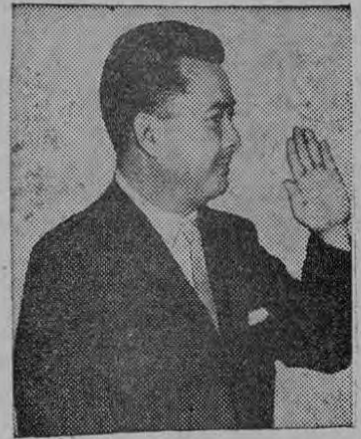
CONGRESISTA DEL QUINCUAGÉSIMO ESTADO. — Daniel K. Inouye, de 34 años, Demócrata y primer americano de ancestro japonés en ocupar un puesto en el Congreso americano, presta juramento en una ceremonia especial en Washington.

PARIS, agosto (ANSA). — En 1965, el Sahara producirá de 46 a 50 millones de toneladas de petróleo. Así lo ha declarado el Ministro delegado a la Presidencia del Consejo, Jacques Soustelle, en una entrevista concedida al diario "Paris Presse".